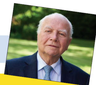
Mark Eyskens, ministre d'Etat

Cette année, c'est sur un thème très actuel que nous aurons le plaisir d'écouter une nouvelle fois :